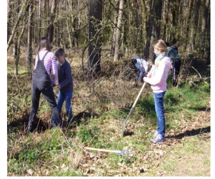
Bilder vom NABU-Herbstferienprojekt aus 2020 und Bio AG der FEG

Die verschiedenen geplanten und terminlich vorzubereitenden Tagesaktivitäten sind in der nachstehenden Übersicht ausgewiesen. Sie orientieren sich zum Teil an den erfolgreich verlaufenen Ferienprogrammen der letzten Jahre. Es sind alles Aktivitäten tagsüber im Nahbereich, so dass die Übernachtung immer zuhause erfolgen kann und nicht vom NABU organisiert werden muss.